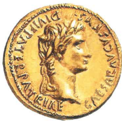
Aureus (zlaták) císaře Augusta, ilustrace

Ochránně měsíce srpna byla bohyně úrody Ceres, po ní se i dnes zrniny označují jako cereálie.