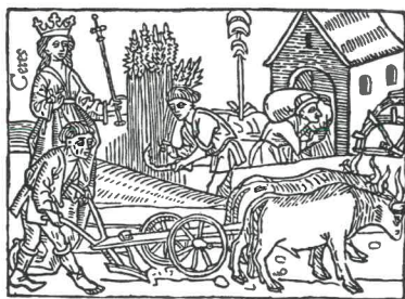
Déméter/Ceres (řecká/římská) bohyně zemědělství, plodnosti země, naučila lidi rolnictví, ilustrace

Charakter měsíce srpna – v průběhu roku je to střed mezi letním slunovratem a rovnodenností, ale především prvním měsícem