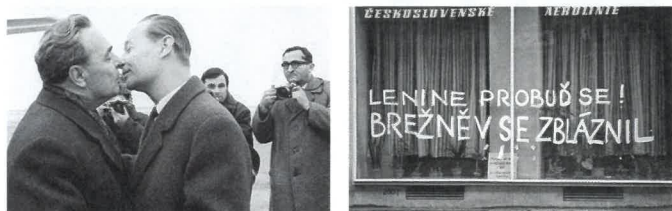
Srpen 1968, ilustrační foto