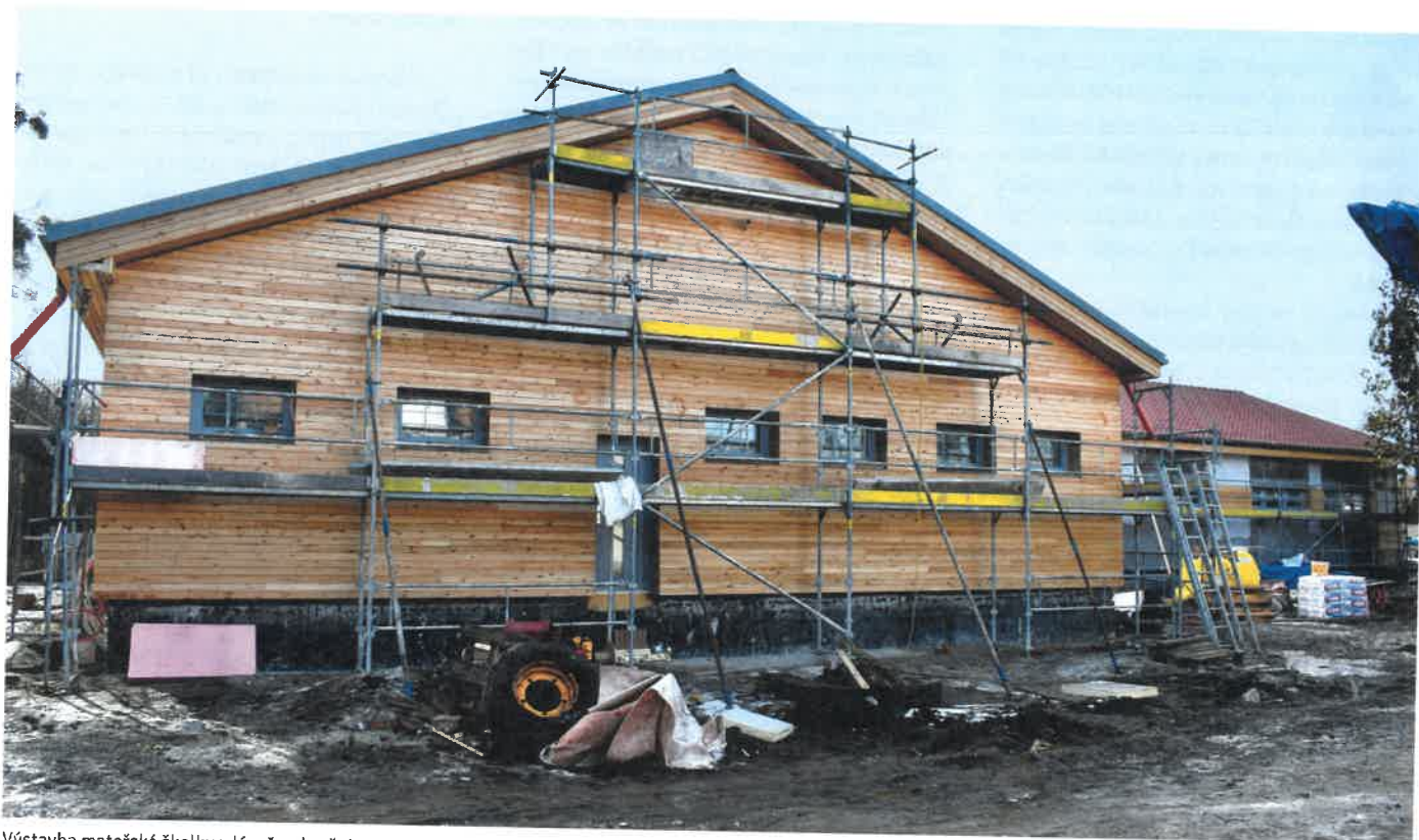
Výstavba mateřské školky zdárně pokračuje