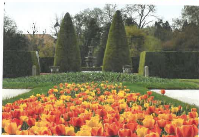
Zámecký park – ilustrační foto Jana Pánkové