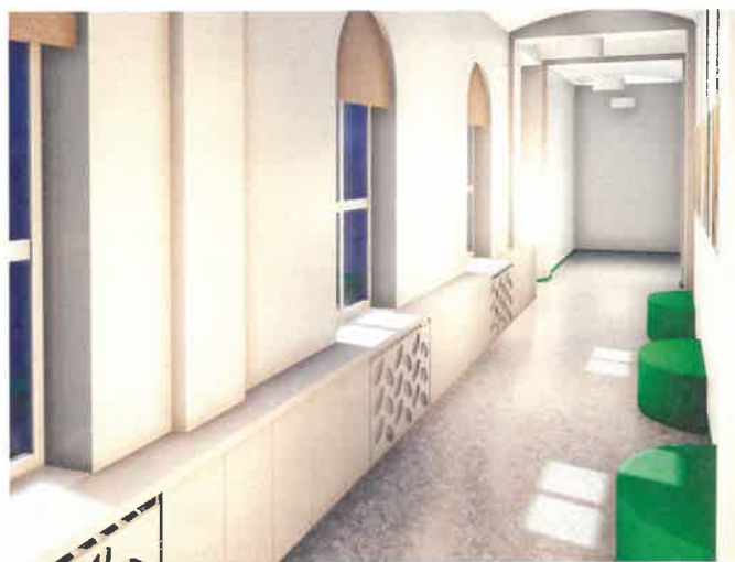
Chodba školy u náměstí po opravě