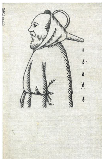
J. Munzar: Medardova kápě aneb pranostiky očima meteorologa (1986), zdroj: www.wikipedia.org

Významné dny – 1. 6. Mezinárodní den dětí, 6. 6. 1944 invaze spojenců do Francie, 10. 6. 1942 Vyhlazení Lidic, 21. 6. 1621 poprava českých pánů na Staroměst. náměstí v Praze , 22. 6. 1941 přepadení SSSR Německem, 27. 6. Den obětí komunistického režimu, 28. 6. 1389 po prohrané bitvě na Kosovu s Turky následovalo 500 let turecké poroby poražených Srbů.