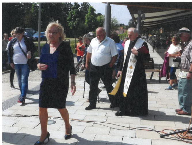
Májová slavnost s otevřením lázeňské sezony.