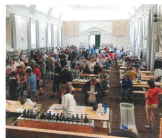
Výstava vín v zámeckých jízdárnách, ilustrační foto, zdroj: www.mcsl.cz

Dne 28. 4. jsem se účastnil výstavy vín v Lednici, kterou pořádal Český zahrádkářský svaz z.o. Lednice, vinařský spolek LVA, Obec Lednice a Multifunkční centrum Zámek Lednice. Výstava je uváděná jako v pořadí 12. z pohledu místní org. zahrádkářské. Ale z pohledu obce Lednice je to už výstava po řadě osmáctá, jelikož 5 výstav už uskutečnili studenti VŠZ v letech 1990–94. Zvláštností výstavy bylo, že hlavní část výstavy měla vzorky drobných pěstitelů zahrádkářů, které byly hodnoceny systémem do 20 a menší část se vzorky od vinařských podniků hodnocených bodovým systémem do 100, který je zaveden ve světě. O účelu takto po skupinách vystavených vzorků nebyla zmínka ani skupinové srovnání jak v množství, tak v kvalitě. To by ovšem určitě bylo velmi zajímavé a možná na příštích výstavách k tomu dojde. Co do množství vystavených vzorků – 351 – to byl nižší průměr dle dosavadních výstav, kdy bylo 218 – 631 vzorků. Letos bylo diplomy oceněno 41% a vloni jen 34% vystavených vzorků. Katalog výstavy je velmi přehledný s pochvalnými charakteristikami vystavených odrůd révy, zejména odrůd nových, za co děkují nejen laická veřejnost, ale i vinaři.