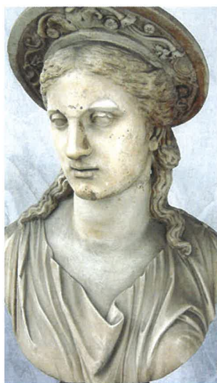
Hera, ilustrační foto

Svátky církevní – 4. 6. Boží hod svatodušní, 24. 6. Narození sv. Jana Křtitele , 29. 6. Slavnost sv. Petra a Pavla. Červen je připomínán mnohými pranostikami – od Medarda a báje Svatojánské noci .