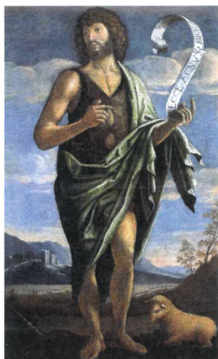
Bartolomeo Veneto: Jan Křtitel, ilustrační foto, zdroj: www.wikipedia.org

Významné dny – 1. 6. Mezinárodní den dětí, 6. 6. 1944 invaze spojenců do Francie, 10. 6. 1942 Vyhlazení Lidic, 21. 6. 1621 poprava českých pánů na Staroměst. náměstí v Praze , 22. 6. 1941 přepadení SSSR Německem, 27. 6. Den obětí komunistického režimu, 28. 6. 1389 po prohrané bitvě na Kosovu s Turky následovalo 500 let turecké poroby poražených Srbů.