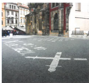
Místo popravy a smutný konec stavovského povstání připomínají dlažební kostky s kříží, které vyznačují prostor, kde stálo popraviště, ilustrační foto