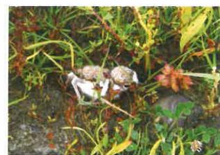
Několikadenní mláďe kulíka říčního mezi vegetací na obnaženém dnu rybníka

v dnešní krajině nebezpečně ubývají hnízdní možnosti. Jejich hnízda jsou velmi nenápadná, často se jedná jen o důlek ohrazený vegetací (čejka chocholatá) nebo vystlaný kamínky či úlomky lastur (kulík říční), a proto hrozí jejich zašlápnutí. Mláďata bahňáků mají čerstvě po vylíhnutí zakódovaný reflex na ochranu proti predátorům. Na varovný hlas jednoho z rodičů zůstanou ve strnulé poloze přikrčení k zemi. Tento reflex a maskovací kresba prachového peří je učiní prakticky neviditelnými, a zachrání je tak před pátravým zrakem predátora, který reaguje na pohyb. Proti botě procházejícího člověka je ale tento způsob ochrany neúčinný. Kromě čejky chocholaté a kulíka říčního zde nelze vyloučit zahnízdění vodouše rudonohého, ptáka, jehož si jako cílový druh pro rok 2017 (obdobu celostátní kampaně Pták roku) zvolila jihomoravská pobočka České společnosti ornitologické, nebo i dalších vzácnějších bahňáků (např. tenkozobce opačného).