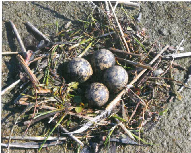
Hnízdo čejky chocholaté

V letošním roce připadlo letnění na Prostřední rybník. Tento rybník bude od 15. března alespoň do 15. července (pokud nedojde k povodňovému stavu) na snížené hladině. Na začátku letnění bude úplně obnažena část dna o rozloze cca 6 ha z celkových 47 ha plochy rybníka. Již od počátku bude možné se dostat z jižního břehu suchou nohou na oba ostrůvky. I když bude tento stav nepochybně lákat k návštěvě těchto ostrůvků a k procházce podél jižního a při dalším poklesu hladiny i severního (lednického) břehu, žádáme návštěvníky, aby těmto svodům odolali. Pohybem po obnaženém dně totiž dochází k rušení ptáků, kteří tuto jedinečnou událost jistě využijí v hojném počtu k odpočinku a doplnění sil při jarním i podzimním tahu. Na ostrůvcích mohou už od začátku března hnízdit husy velké. Neustálé rušení hus při hnízdění může vést k zastydnutí snůšky, čímž se ochudíme o dubnová pozorování poslů jara – husích rodinek s čerstvě vyvedenými žlutými housaty. Na holých písčitých dnech si svá hnízda s oblibou staví bahňáci – ptáci, kterým