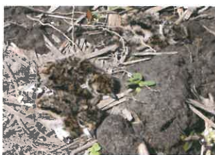
Jednodenní mláďata čejky chocholaté v ochranné poloze lze snadno přehlédnout