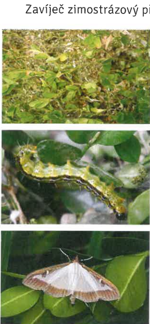
1 – napadený keř 2 – housenka 3 – motýl

Zavíječ zimostrázový ( Cydalima perspectalis ) pochází z Asie a na našem území je to relativně nový druh motýla. Byl zde zaznamenán v roce 2011. Jeho přítomnosti na určité lokalitě si povšimneme většinou až při žíru housenek, kdy je většina listové plochy již zničena.