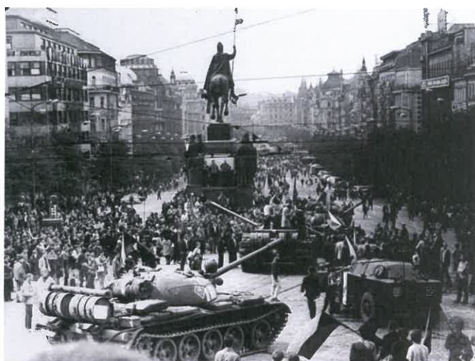
Srpnová invaze (ilustrační foto,)