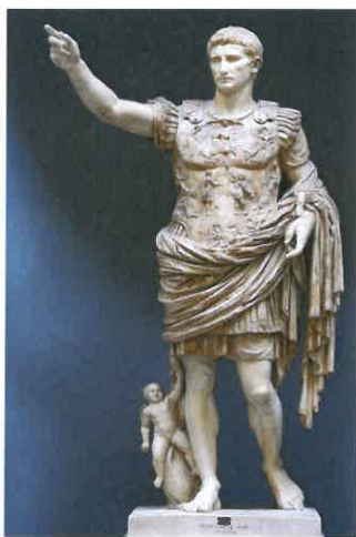
Augustova socha (ilustrační foto, zdroj www.wikipedia.org )

Významné dny: 23. 8. 1944 svržen fašistický režim v Rumunsku, 25. 8. 1944 osvobozena Paříž, 29. 8. 1944 vypuklo Slovenské národní povstání, s kterým současně už od 1. 8. 1944 probíhalo Varšavské povstání. Obě povstání byla potlačena německými vojsky, jelikož sovětská pomoc slovenskému přišla pozdě a varšavskému vůbec.