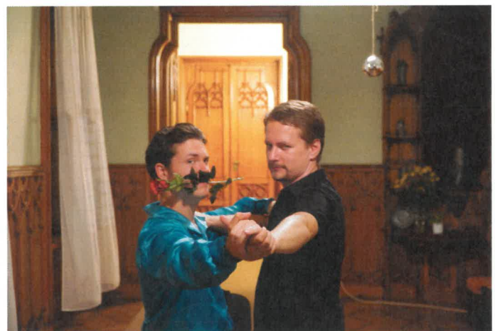
Noční prohlídky aneb Filmový zámek (ilustrační foto z letošního roku)