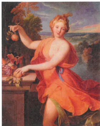
Pomona, Nicolas Fouché, olejomalba, okolo 1700, ilustrační foto

Měsíc září, římsky September (sedmý) – to mu zůstalo ze starého římského kalendáře, i když byl devátý. Hlavní vládkyní měsíce byla významná bohyně Pomona, patronka ovoce a stromů . Tím byl dán také charakter měsíce. Byl nazýván měsícem sklizní, kdy všeobecně probíhá zrání ovoce na stromech a keřích a ještě pořád dosti dlouhé krásné dny podzimní rovnodennosti dopřávaly dobrému dozrání a včasné sklizni. Pranostika o tom říká – září fouká mírně, dokud ovoce není ve spížirně .