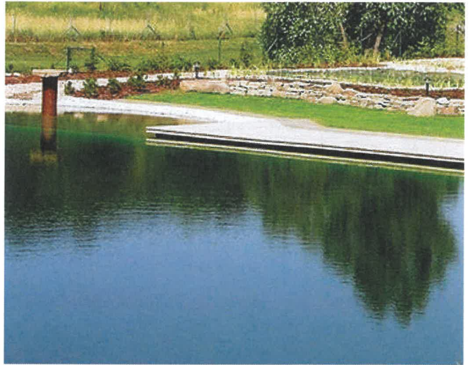
Přírodní koupaliště (ilustrační foto)