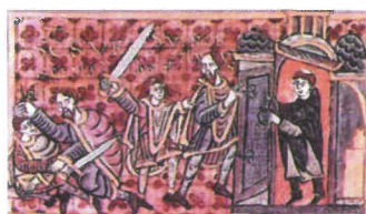
Illuminace zachycující vraždu svatého Václava ve Staré Boleslavi, ilustrační foto

Slvatky – 28. září máme dvojité svátek – církevní – slavnost sv. Václava, který je současně státním svátkem Den české státnosti .