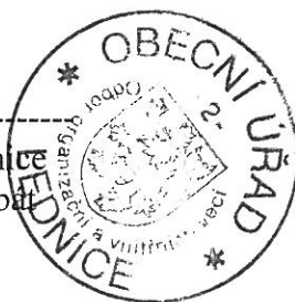
Obecní úřad Lednice RNDr. Libor Kabát

http://www.lednice.cz/sections/cs_section2/zpravodaj/zpravodaj-obce-lednice/zpravodaj-zari-2010/zpravodaj-lednice-zari-2010.pdf