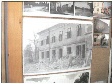
Fotka, kvůli níž vznikl spor

V úterý 21. 4. 2015 se v prostorách TIC konala vernisáž fotografií doplněná výstavou modelů bojových vozidel jak sovětských, tak německých. Staré fotografie vyvolávaly v pamětnících vzpomínky, v ostatních představy, jak to v Lednici vypadalo, když ještě nebyli na světě či byli příliš malí nebo zde ještě nebydleli. Dokonce zde vypukl i „spor“ nad jednou fotografií. Část návštěvníků si myslela, že je to fara, část se přikláníla k pohledu na zámecký hotel ze dvora. Nedalo se nic dělat, Leoš Tržil a pan Mráz – dva zastánci protichůdných názorů se dokonce vydali na zámecký hotel najít pravdu. I poražený pan Mráz uznal, že Leoš měl pravdu – je to hotel.