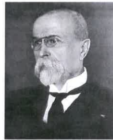
Tomáš Garrigue Masaryk (ilustrační foto)