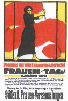
Plakát ženského hnutí za volební práva žen, 8. března 1914

7. března 1850 se narodil TGM, náš první prezident ČSR. 28. března 1592 se narodil Jan Amos Komenský, náš učitel národů. 2. března 1824 se narodil Bedřich Smetana.