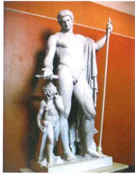
Bůh Ares

Měsíc březen řím. Martius je zasvěcen bohu Martovi (u Řeků Aresovi), známému jako bohovi války, ale také ochránci zemědělství, coby nejpočetnější práci, zřejmě, aby ulehčili svému válečnému svědomí. U Keltů je březen do 18. 3. ve znamení jasanu a po něm ve znamení olše. Z pranostik, kterých je na březen spousta, uvádím jen: Kolik března mlhy tají, tolik mrazů bude v máji.