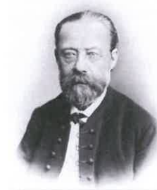
Bedřich Smetana (ilustrační foto )