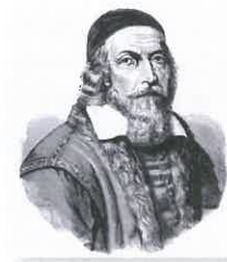
Jan Amos Komenský (ilustrační foto,)