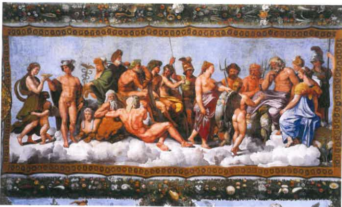
Rada bohů – Raphael Santi /1483 – 1520/ (ilustrační foto)