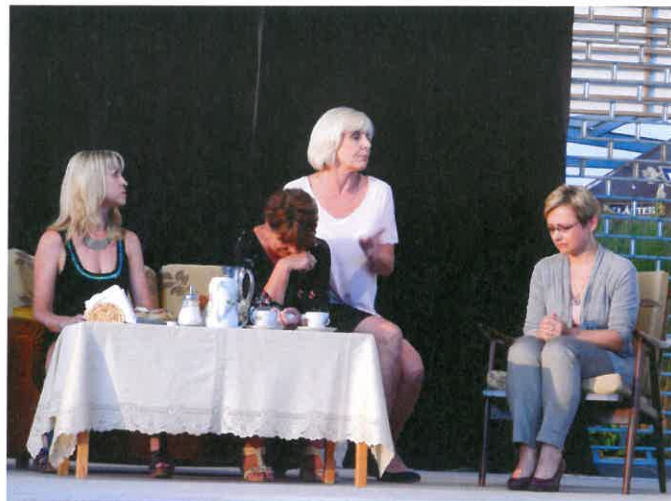
5 za jednu