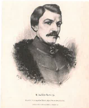
Karel Havlíček Borovský od Jana Vilímka (ilustrační foto: wikipedia.org)

českého národa vedle Palackého. Když v březnu 1849 nastoupil Bachův absolutismus, většina českých politiků se stáhla do ústraní. Jediný Havlíček dále pokračoval ve svých novinách v odhalování zpátečnickví vlády a měl silný vliv na myšlení české veřejnosti.