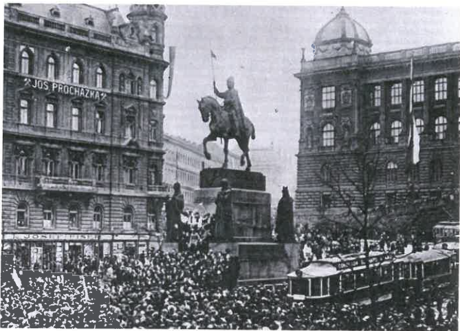
Demonstrace na Václavském náměstí 28. 10. 1918