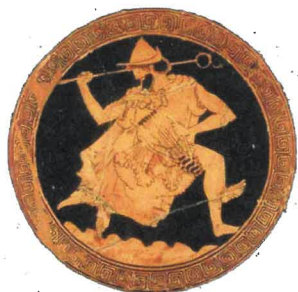
Hermes, ilustrační foto

Měsíc květen lat. Maius byl bohem jménem Hermes , bohem obchodníků a zlodějů, pojmenován po jeho matce Maie neboli Majiesta (bohyně jara). 23. 5. se v Římě konaly slavnosti Rozálie, v dnešní době to připomínají výstavy květin Flora.