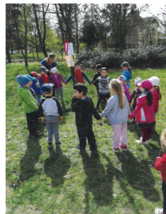
Jaro, kde jsi?