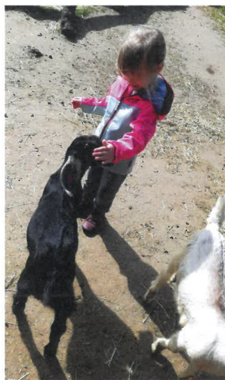
Na Stáji Salma