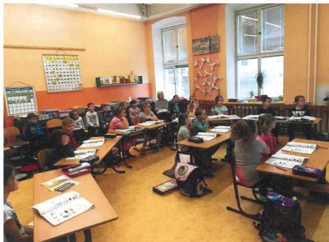
Předškoláci na návštěvě v 1. třídě