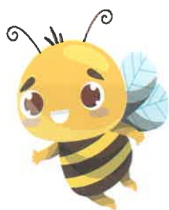
Včelíčky s pejsky