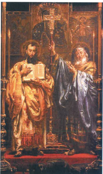
Svatí Cyril a Metoděj. Obraz polského malíře Jana Matejky z roku 1885, ilustrační foto

Významné dny – 17. 7. 1945 začala Postupimská konference , která mimo jiné rozhodla o odsunu Němců. Z ČSR bylo odsunuto 2 440 000 osob .