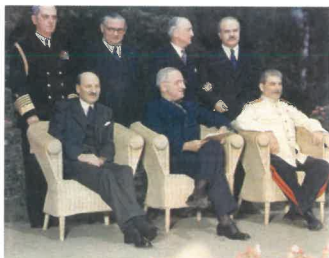
Zástupci velmocí na postupimské konferenci (sedící zleva: Clement Attlee, Harry Truman, Josef Stalin), ilustrační foto

Charakteristika měsíce července – je nejhornější měsíc roku, proto je občasný déšť zvláště důležitý pro veškeré rostliny a zejména pro zemědělské plodiny, jelikož zabezpečují výživu lidí i zvířat. Proto pranostika říká – déšť v červenci, kdy zraje pšenice, má cenu páru volů i ještě více .