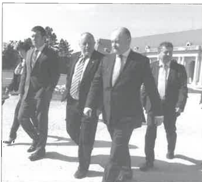
Společně navštívili jízďárny, zámek, nově budovanou kolonádu a lázeňský dům Perla