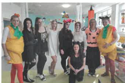
Paní učitelky vzaly přípravu na Halloween zodpovědně