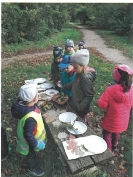
Tematická vycházka Podzimníček