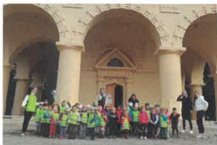
Výlet lodičkami k Minaretu