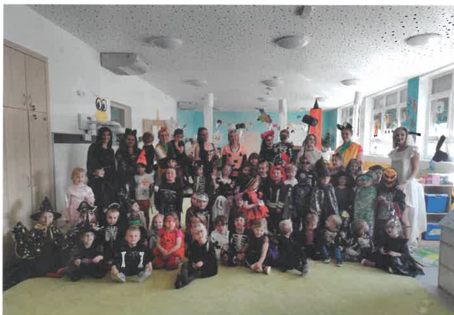
Halloween v MŠ