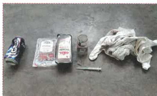
Obsah „tříděného“ plasty

Firma Hantály a.s., která realizuje svoz vytříděného odpadu, žádá občany města/obce, aby do sběrných nádob na tříděný odpad odkládali pouze odpad k tomu určený. Vyseparované plasty putují na dotřídňovací linku, kde pracovníci linky ručně třídí vše, co tam nepatří. Bohužel se v plastu ne zřídka objevuje zdravotnický materiál – jehly, střepty, znečištěný hygienický materiál, nebo uhynulá zvířata. Při třídění jednotlivých složek plastového odpadu může dojít ke zranění zaměstnanců. Žádáme proto občany o důsledné a zodpovědné třídění s vědomím, že odpad nekončí ve spalovně, ale dále s ním nakládají lidé. Děkujeme za pochopení.