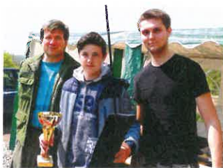
Vyhlašování dětských závodů

V neděli navštívilo závody celkem 47 dětí, které ulovily celkem 4 kapry, 2 líny a 91 ks bílé ryby.