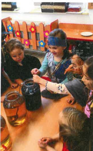
Lektvar z hadích ocásků