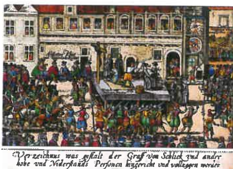
L. P. 1621 POPRAVA 27 ČESKÝCH PÁNŮ NA STAROMĚSTSKÉM NÁMĚSTÍ V PRAZE

Z historie bych připomněl 21. červen 1621, kdy bylo popraveno 27 českých pánů na Staroměstském náměstí v Praze.