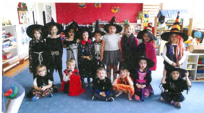
Čarodějky a čarodějové z Kuřátek