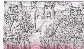
ČESKÁ REPUBLIKA 26 Kč

Grafika znázorňující popravu 27 českých pánů na Staroměstském náměstí v Praze (ilustrační foto, zdroj www.wikipedia.org) a známka vydaná k tomuto výročí (ilustrační foto, zdroj www.infofila.cz)