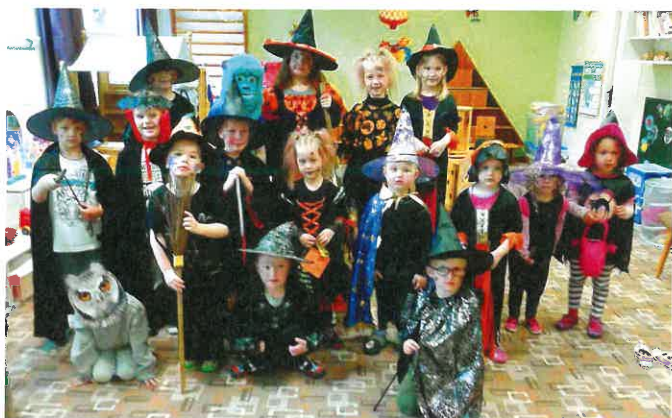
Čarodějky a čarodějové ze Sluníček