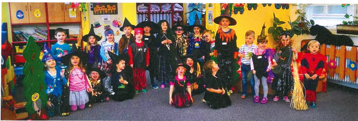
Čarodějky a čarodějové z Kofátek a Sluníček