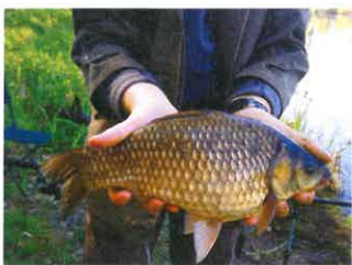
Jeden z mnoha karasů