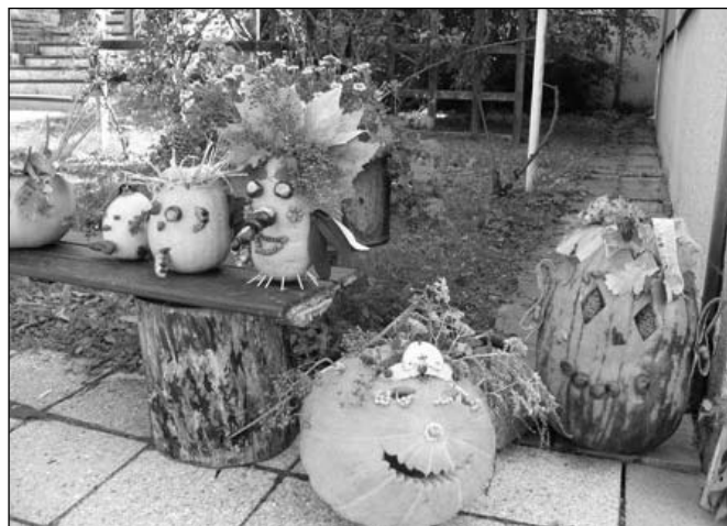
Je to náš kamarád, každý si s ním bude hrát.

V nejbližší době ještě chystáme společnou prohlídku strašidel v zámecké jeskyni.