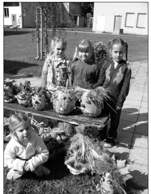
Úsměv, prosím! Ještě jedno foto.

„Veselé dýňování“ se stalo tradicí naší mateřské školy a je ukončeno posezením u táboráku a opékáním špekáčků.