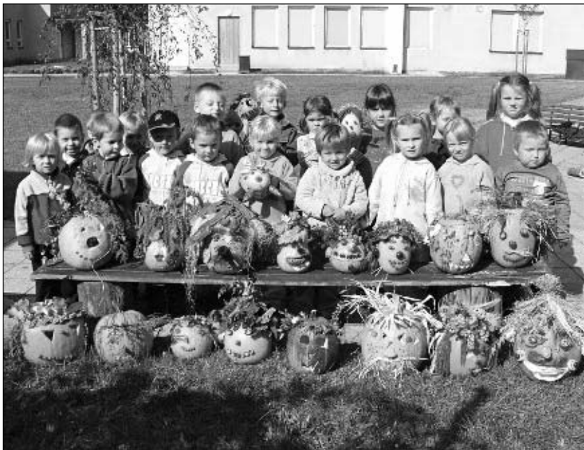
Hu, hu hu, Dýňák už je tu!

Akce pro rodiče a děti na školní zahradě „Veselé dýňování“